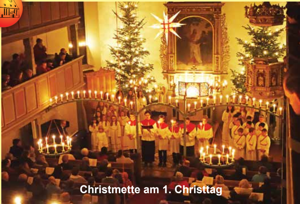
Christmette am 1. Christtag