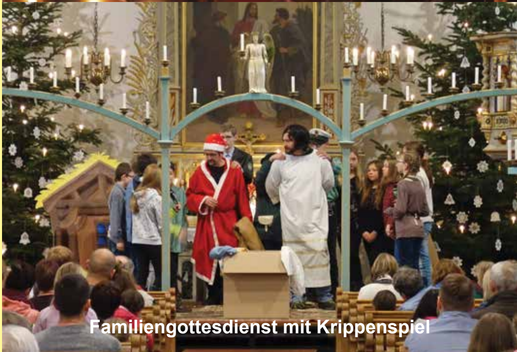
Familiengottesdienst mit Krippenspiel